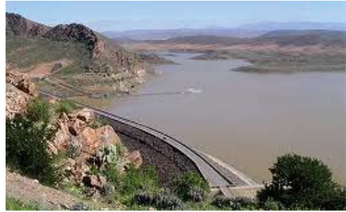
Assurer une gestion rationnelle des ressources en eau

Compte tenu de la faiblesse des politiques agricoles (progrès technologiques modestes, usage limité d'instruments de gestion du risque sécheresse, capacités d'irrigation insuffisantes, politiques de gestion des terres inadaptées) et commerciales (politique de libre échange, exigences européennes) menées jusqu'à maintenant, le changement climatique risque d'avoir des conséquences drastiques sur la productivité agricole, déjà faible, et les échanges commerciaux agricoles, engendrant des effets néfastes sur la situation macroéconomique (déficit de la balance des paiements, inflation) et sociale (perte d'emplois, baisse