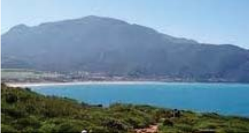
Le littoral subit une forte pression

réchauffement de l'eau avec comme conséquence l'extinction de la vie marine qui en dépend.