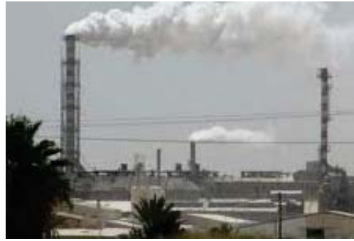
Limiter les émissions de gaz à effet de serre

La déclaration reconnaît l'impact négatif du changement climatique et de la dégradation des ressources naturelles sur les économies ainsi que les opportunités offertes par le passage à une économie verte pour relancer la croissance, vaincre la pauvreté et créer des emplois .