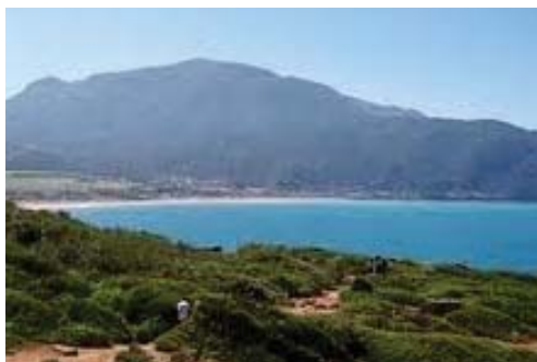
Le littoral subit une forte pression

nombre de pays en développement, notamment les principales économies émergentes ont convenus de mettre en œuvre des mesures d'atténuation et de faire part tous les deux ans des résultats obtenus.