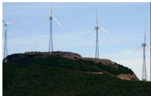
Par éolien au Nord du Maroc (Koudia Al Baïda)

importateurs de pétrole (plus de 95% de leurs besoins énergétiques sont importés). Même si cette tendance est appelée à demeurer encore assez longtemps, la transition vers les technologies à faible émission de carbone a commencé. Pour garantir leur sécurité énergétique et faire face à la demande croissante (6 à 8% par an en moyenne), les pays de la région ont mis en place des stratégies et des programmes et se sont fixé des objectifs ambitieux, visant à accroître significativement la part des énergies renouvelables dans leur bilan énergétique total (~ 20%, à l'horizon 2020) et à promouvoir l'efficacité énergétique. L'Égypte, le Maroc et la Tunisie représentent aujourd'hui 95% de la capacité installée totale en matière d'énergie éolienne en Afrique