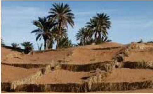
Lutter contre la désertification

pement économique, croissance démographique, urbanisation accélérée, évolution des modes de vie) pourrait encore s'accroître du fait des besoins supplémentaires nécessaires pour s'adapter aux effets du changement climatique tels que : le dessalement de l'eau, la climatisation des bâtiments, etc. En outre, dans certains pays, la production hydroélectrique pourrait être affectée par le climat.