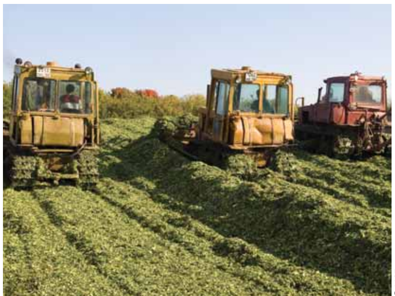
Московская область, Россия

Резолюция о вкладе Международной организации труда в защиту и оздоровление производственной среды, МОТ, 1972 г.