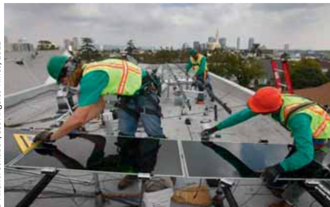
Установка солнечных батарей

Благодаря постоянной общественной поддержке, увеличению инвестиций и расширению производственных мощностей занятость в секторе возобновляемых источников энергии растет быстрыми темпами, которые, похоже, в ближайшие годы будут только возрастать. Объекты энергетики, использующие возобновляемые источники энергии, позволяют создавать больше рабочих мест на единицу установленной мощности, произведенной электроэнергии и вложенных средств, чем электростанции, работающие на органическом топливе. По самым скромным подсчетам, численность занятых в секторе возобновляемых источников энергии во всем мире в настоящее время составляет примерно 4,2 млн чел. Половина этих рабочих мест сосредоточена в подсекторе биотоплива, главным образом в сфере выращивания и сбора сырья, а также в перерабатывающих отраслях промышленности. При быстро растущем интересе к альтернативным источникам энергии вполне вероятно, что в будущем численность занятых в данном секторе будет стремительно возрастать и к 2030 году, возможно, достигнет 20 млн чел. 8 Прогнозы по отдельным странам указывают на наличие значительного потенциала в плане создания новых рабочих мест в предстоящие годы и десятилетия. Особенно заметную роль в разработке технологий использования возобновляемых источников энергии играют такие страны, как Германия, Япония, Китай, Бразилия и Соединенные Штаты, и именно в них пока сосредоточена большая часть занятых в этом секторе. Бо-