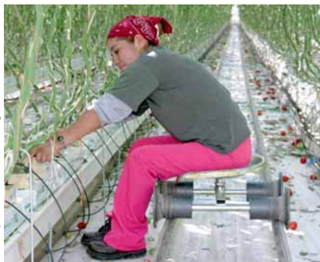
Гидропоника в сельском хозяйстве

Устойчивое сельское хозяйство предполагает сочетание таких аспектов, как гигиена окружающей среды, экономическая жизнеспособность и социальная справедливость, в том числе рациональное использование природных ресурсов. Кроме того, устойчивое сельское хозяйство подразумевает сокращение объемов, замену или полное устранение применяемых агрохимикатов, таких как пестициды, удобрения и др., а также осуществление почвозащитных мероприятий наподобие нулевой обработки почвы, обогащения органическими веществами и водосберегающей ирригации.