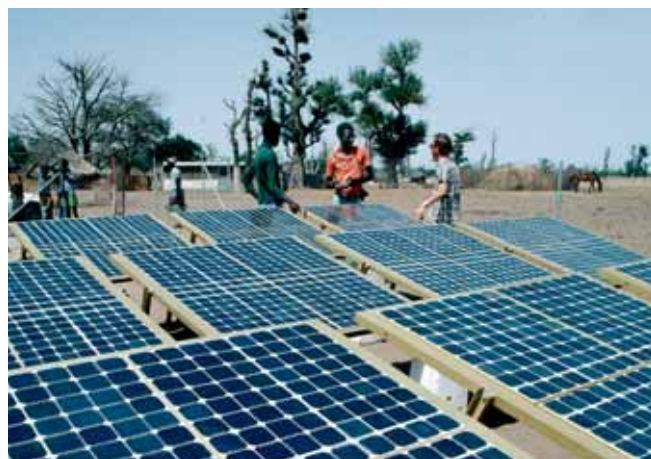
Солнечные панели в Сенегале

для перемещения работников и выполнения работ, работы на высоте, ручной и механический инструмент, электрический ток, ограниченное и замкнутое пространство, хранение химических веществ и обращение с ними). Источниками опасностей и рисков могут быть также возникающие новые ситуации (например, высотные работы по монтажу оборудования для использования возобновляемых источников энергии, подключение к интеллектуальным энергосистемам) в сочетании с применением новых строительных материалов (например, кирпичи, изоляционные материалы и краски, содержащие наноматериалы).