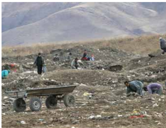
Полигон бытовых отходов, Киргизстан