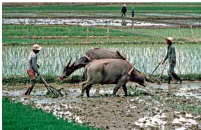
Работа на рисовых полях