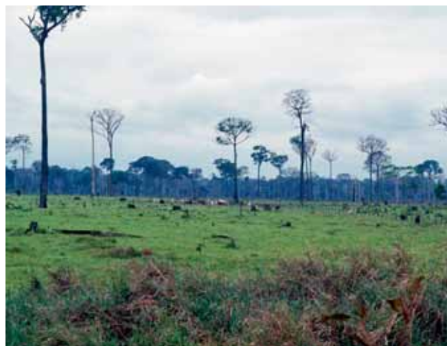
Вырубка лесов в Бразилии

Примерно 18 процентов всех выбросов парниковых газов приходится на долю вырубки и вырождения лесов, которые в этом плане уступают только сельскому хозяйству и транспортному сектору. При экологически устойчивом лесопользовании присутствуют такие же опасные производственные факторы и риски, как и при обычных методах ведения лесного хозяйства. Основное различие заключается в том, что экологически устойчивое лесопользование