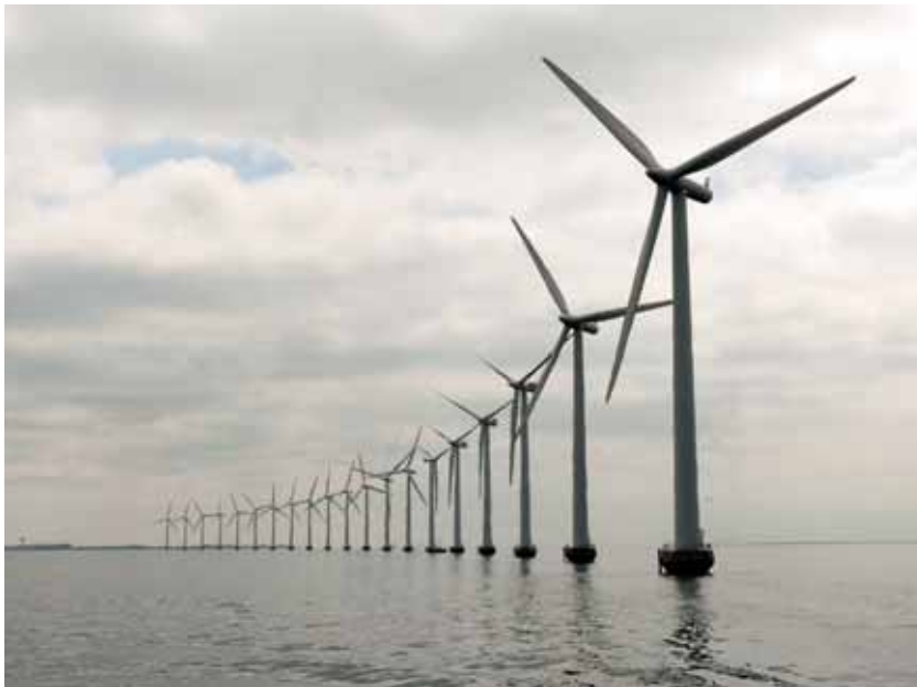
Ветропарк Миддельгрюнден в Дании

«зеленых» рабочих местах. Другим важным аспектом, подлежащим учету, является анализ «зеленых» рабочих мест по стадиям жизненного цикла, при котором рассматриваются все аспекты и воздействия рабочего места и логистической цепочки, а не только их «нейтральность» в плане изменения климата. В особенности это касается таких секторов, как строительство, утилизация отходов, солнечная энергетика и переработка биомассы.