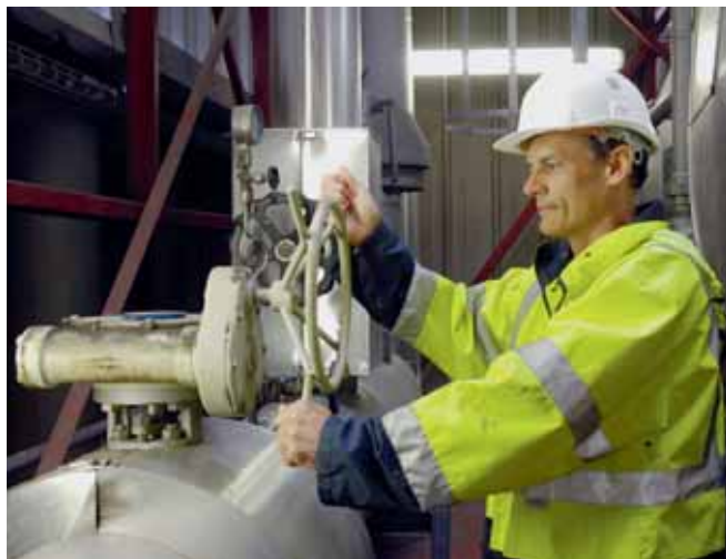
Центр по переработке отходов

на соответствующих рабочих местах, в настоящее время занимает в дискуссиях все более заметное место. Хотя эти рабочие места, как предполагается, должны помочь оздоровить окружающую среду, оживить экономику и создать новые возможности трудоустройства, существует большой риск, что при поспешном создании таких новых рабочих мест в больших количествах не будет уделяться внимания их качеству, а также вероятности повышения производственного травматизма, и заболеваемости, и даже смертности, до принятия необходимых защитных мер. Работники на «зеленых» рабочих местах могут столкнуться с опасными производственными факторами, повсеместно присутствующими и на обычных предприятиях. Для многих работников, переходящих в быстро развивающиеся «зеленые» отрасли, эти опасные факторы могут оказаться новыми. Кроме того, они могут попасть под воздействие и по-настоящему новых опасных факторов, которые ранее были неизвестны. Например, при отсутствии надлежащих средств защиты работники сектора солнечной энергетики могут подвергаться воздействию теллуристого кадмия (общеизвестный канцероген). Именно поэтому на данном этапе крайне необходимо обеспечить, чтобы процесс создания «зеленых» рабочих мест изначально предусматривал разработку предупредительных стратегий, нацеленных на предвосхищение, выявление, оценку и ограничение опасных факторов и рисков, присутствующих на таких рабочих местах.