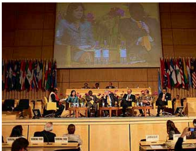
Дискуссии по вопросам мирового финансово-экономического кризиса

Символом более устойчивой экономики и общества, которое бережет окружающую среду для будущих поколений, характеризуется справедливостью и не допускает изоляции каких-либо групп людей или стран, стала «зеленая» экономика. И поэтому ключевым элементом экологически устойчивого экономического и социального развития считается прогресс в направлении «зеленой» экономики, создающей «зеленые» рабочие места и «озеленяющей» существующие отрасли, производственные процессы и места работы. В этом контексте усилия в области социальной интеграции, социального развития и охраны окружающей среды должны быть тесно связаны с усилиями по обеспечению охраны труда и по продвижению достойного труда для всех.