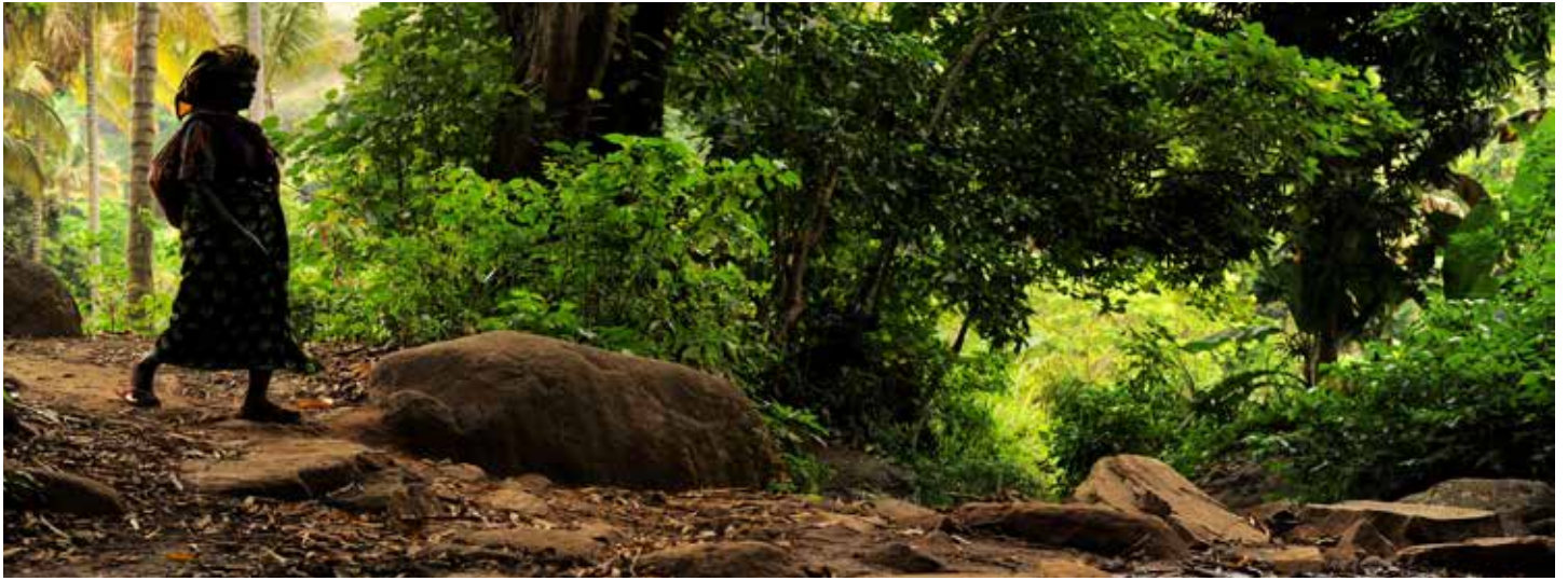
坦桑尼亚一名妇女穿行于溪流之间，后者为气候智能型农业模式下的一个灌溉渠道提供水源。