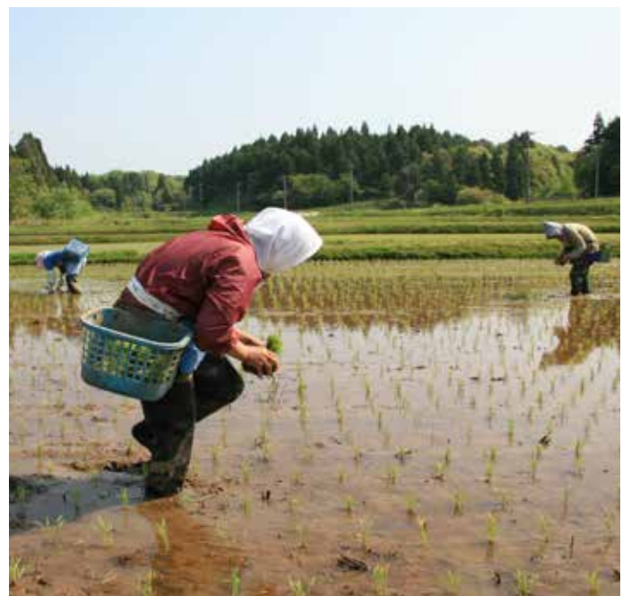
日本里山-里海地景可持续管理能够抵御气候变化的影响。