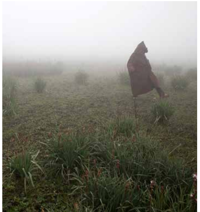
突尼斯一名村民在泥炭沼泽地里行走。