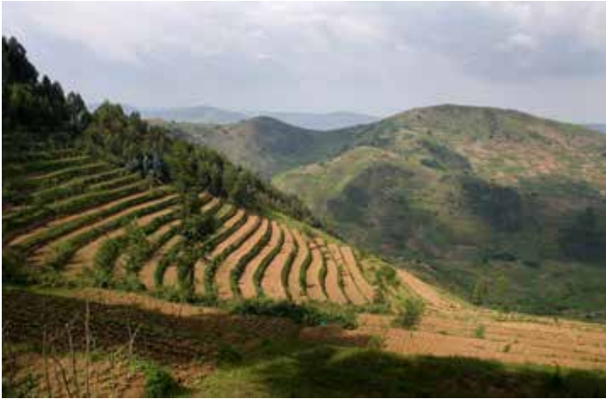
一幅梯田景观。梯田有助于土壤保持水分和防止土壤侵蚀。