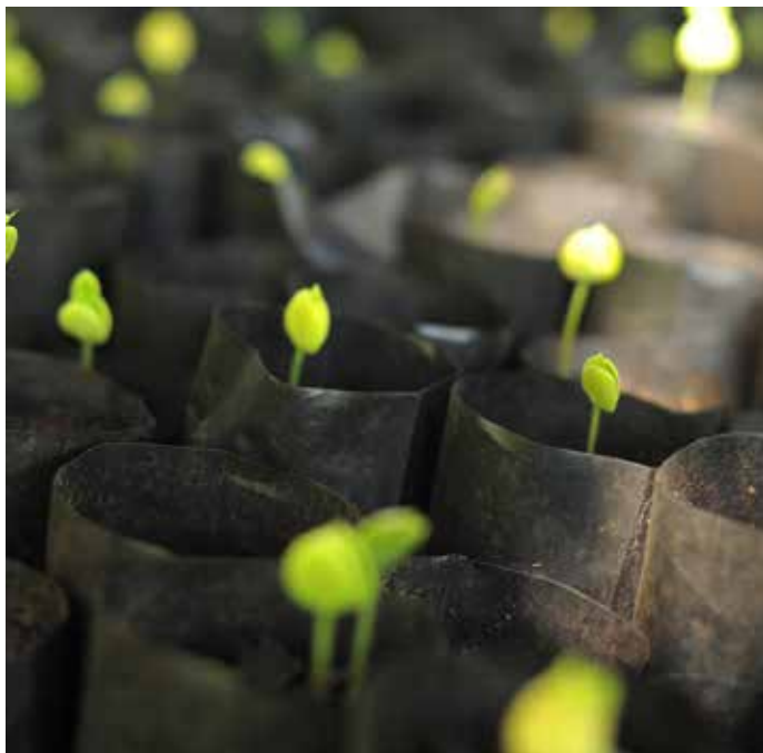
一苗圃中的辣木树苗。辣木树在非洲减缓气候变化和增加贫困家庭收入中发挥重要作用。

气候变化不仅影响土壤，而且严重威胁着全球粮食安全。温度和降雨模式的变化可能对有机物和土壤过程及依赖它们生存的植物和作物造成巨大影响。为了应对全球粮食安全和气候变化的挑战，必须从根本上改变农业和土地管理办法。改进农业和土壤管理实践以增加土壤有机碳的方法，如农业生态学、有机农业、保护性农业和农林业，能够带来多重效益。这类生产方式使土壤肥沃，富含有机质（碳），保持土表植被，需要较少化学投入物，而且促进作物轮作和生物多样性。这种土壤也不太容易受到侵蚀和荒漠化影响，能够维持重要的生态系统服务，如水和养分循环，而这些都是保持和增加粮食产量的重要因素。粮农组织还推广一种被称为“气候智能型农业”的统一方法，为支持其成员国在气候变化条件下实现粮食安全而创造技术、政策和投资条件。“气候智能型农业”方法有助于持续提高生产力和抵御气候变化的能力（适应），并在可能的情况下，减少和消除温室气体（减缓）。