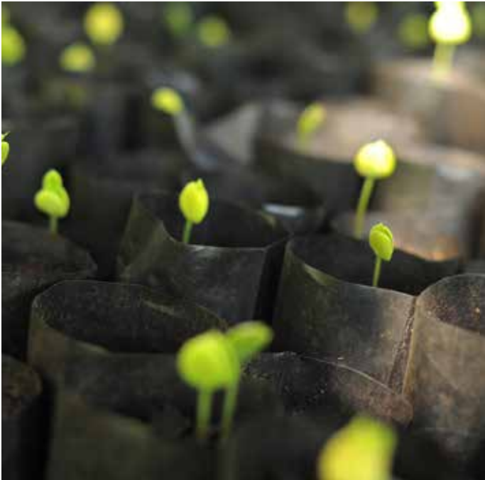
شتلات المورينجا داخل مشتل. شجرة المورينجا يمكن أن تلعب دوراً هاماً في التخفيف من آثار تغير المناخ وزيادة دخل المزارعين الفقراء في أفريقيا © FAO / دانيال هايدوك.