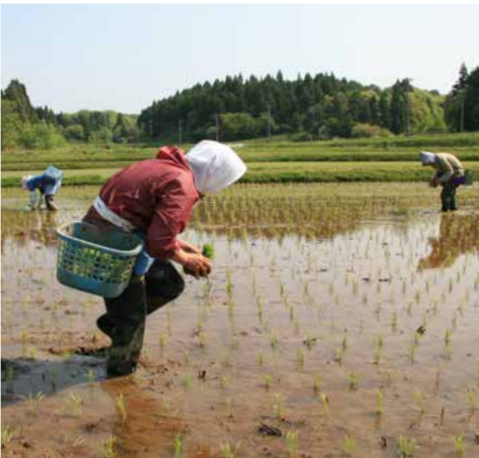
الإدارة المستدامة للمناظر الطبيعية ساتوياما-ساتومي في اليابان تبني القدرة على التكيف مع تغيُّر المناخ © FAO / كاظم فافدري.

التربة، لتخفيض انبعاثات غازات الدفيئة الناجمة عن الزراعة، وتعزيز احتجاز الكربون وبناء القدرة على الصمود في وجه تغيُّر المناخ.