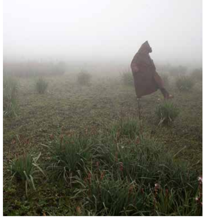
قروي يتمشى عبر مستنقع الخث في تونس © FAO / يوليو نابوليتانو.

يُمثل تغيُّر المناخ تهديداً خطيراً للأمن الغذائي العالمي لأسباب ليس أقلها تأثيراته على التربة. ويمكن للتغيرات في درجات الحرارة وكميات الأمطار أن تؤثر تأثيراً كبيراً على المادة العضوية والعمليات التي تحدث في تربتنا، وكذلك النباتات والمحاصيل التي تنمو فيها. ولكي نواجه التحديات المتصلة بالأمن الغذائي العالمي وتغيُّر المناخ، يجب إحداث تغيير أساسي في ممارسات الزراعة وإدارة الأراضي. وتتحقق فوائد متعددة من خلال تحسين ممارسات الزراعة وإدارة التربة التي تزيد من الكربون العضوي في التربة، مثل الإيكولوجيا الزراعية، والزراعة العضوية، والزراعة التي تحافظ على الموارد، والحراثة الزراعية. وتنتج هذه الممارسات تربة خصبة غنية بالمادة العضوية (الكربون) وتحافظ على الغطاء النباتي للتربة السطحية، وتحتاج إلى مدخلات كيميائية أقل، وتعزز تناوب المحاصيل والتنوع البيولوجي. وهذه الأنواع من التربة تكون أيضاً أقل عرضة للتعرية والتصحّر وتحافظ على خدمات النظم الإيكولوجية الحيوية، مثل الدورة الهيدرولوجية ودورة المغذيات، التي تسهم بدور جوهري في الحفاظ على إنتاج الأغذية وزيادته. وتشجّع المنظمة أيضاً على الأخذ بنهج موحد يعرف باسم الزراعة الذكية مناخياً، لتهيئة الظروف التقنية وظروف السياسات والاستثمارات التي تدعم بلدانها الأعضاء في تحقيق الأمن الغذائي في ظل تغيُّر المناخ. وتزيد ممارسات الزراعة الذكية مناخياً بصورة مستدامة الإنتاجية والقدرة على الصمود في وجه تغيُّر المناخ (التكيف)، بينما تحد من غازات الدفيئة وتزيلها حيثما أمكن (التخفيف).