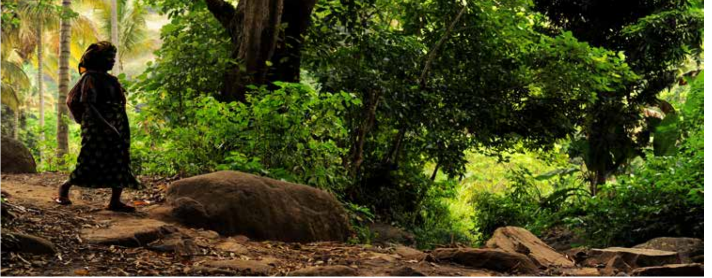
امرأة تعبر واحد من عدة تيارات، والتي تغذي قناة للري مستخدمة في الزراعة الذكية مناخيا في تنزانيا.