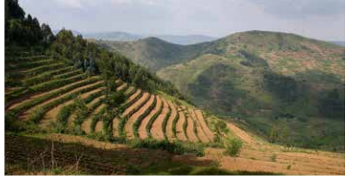
منظر للتلال المُدرّجة، والتي تساعد التربة في الاحتفاظ بالمياه ومنع انجرافها

يشارك المزارعون في إجراءاتها. وتلقى نحو 9 000 مزارع في كلا البلدين، تمثل النساء 40 في المائة منهم، تدريباً على الزراعة الذكية مناخياً، وأسفر ذلك عن استخدام 736 موقداً من مواقد الطهي التي تتميز بكفاءة استهلاك الطاقة وذلك للحد من إزالة الغابات. وأنشئ 79 مشتلًا للأشجار، ويجري غرس 417 000 شتلة أشجار، وإنشاء 6 هكتارات من المدرجات (في 204 مزارع) للحفاظ على التربة والمياه. وتم أيضاً تركيب وحدتين هاضمتين للغاز الحيوي لإنتاج الطاقة المتجددة من روث الأبقار.