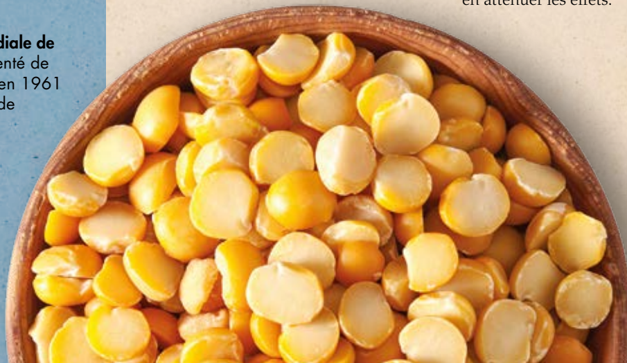
POIS CULTIVÉ ( PISUM SATIVUM )

Les légumineuses sont intelligentes face au climat: elles ont non seulement la capacité de s'adapter au changement climatique mais elles contribuent aussi à en atténuer les effets.